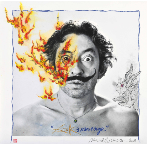
Mark Brusse / Roberto Battistini "DALI'S REVENGE" 110 x 110 cm Pastel gras et pigments sur papier Fine art 350g. 2016 -