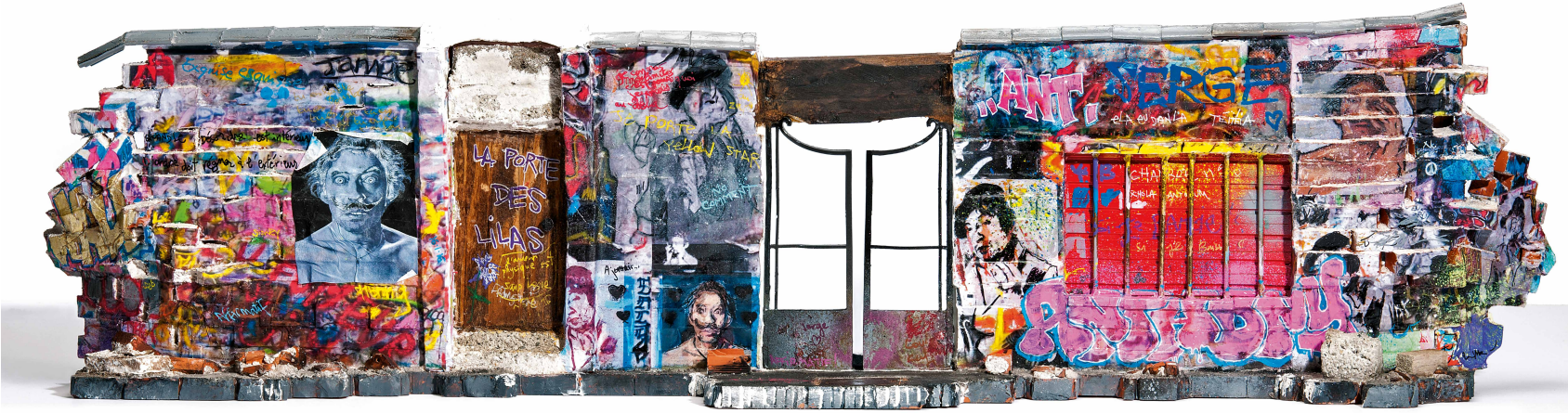
"RUE DE VERNEUIL VARIATION N° 2" 23,5 X 88 X 15,5 cm Technique mixte. Sculpture, peinture, aérogéographie, collages. - 2016 - Courtesy Galerie Keza. Lord Anthony Cahn / Roberto Battistini