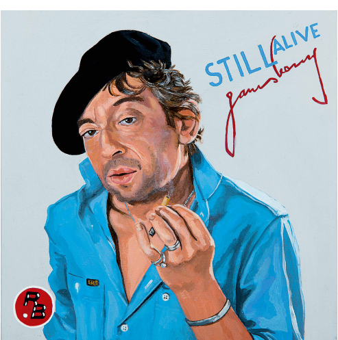
JMK / Roberto Battistini "SERGE GAINSBORG STILL ALIVE 1" 20 x 20 cm Acrylique sur bois, vernis. - 2016 - Collection particulière.