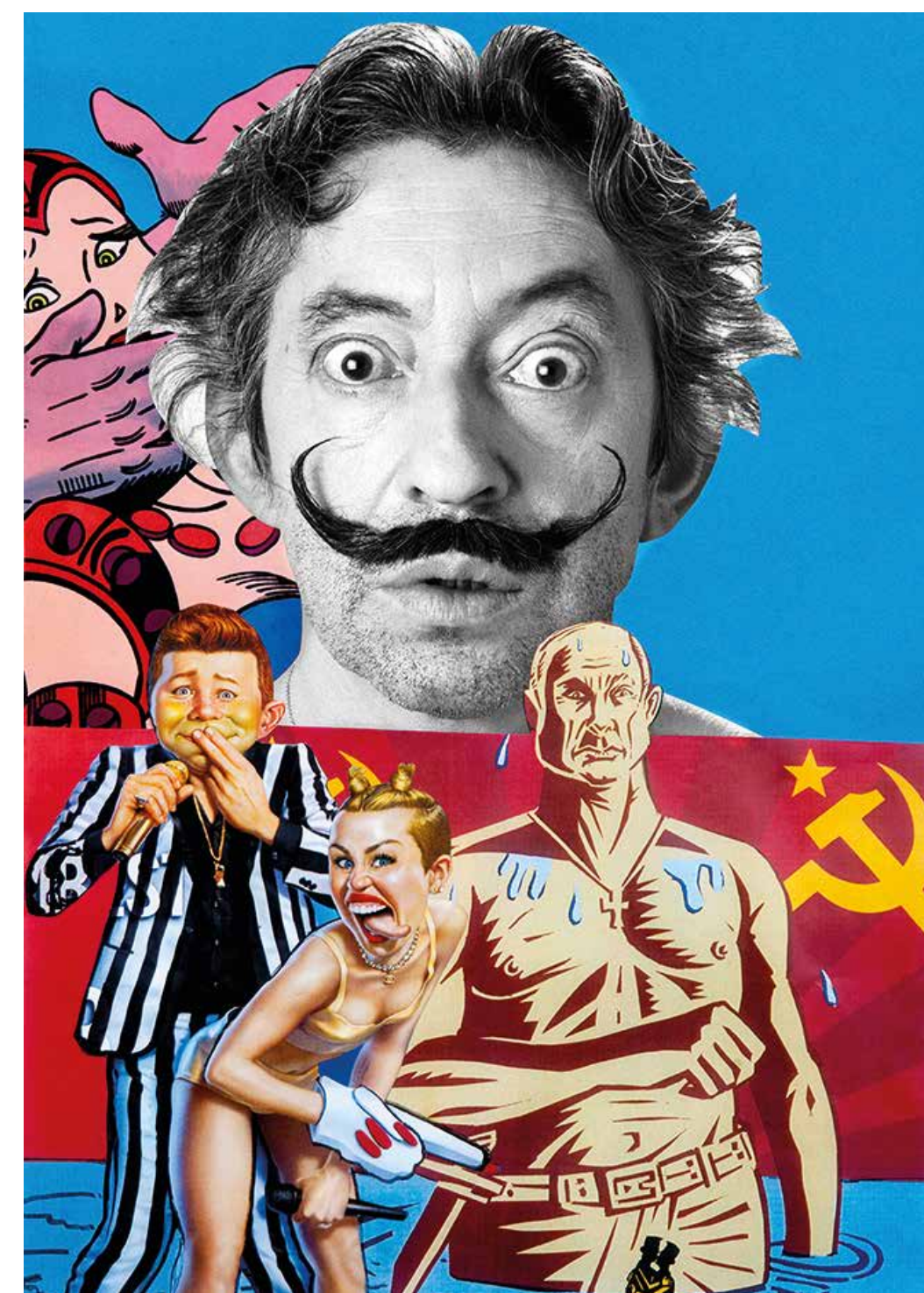
Erró / Roberto Battistini "GAINSBORG-DALI" 38 x 53 cm Techniques mixtes, collages. 2015 -